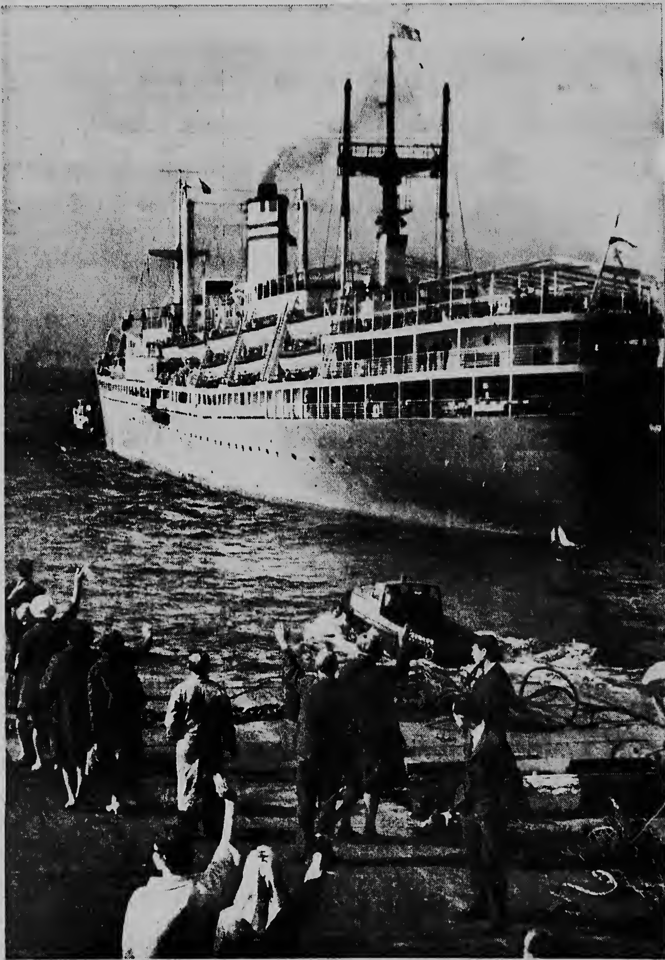
„Rotterdam“ a sali Hulanda pa busca e militar na Nieuw Guinea. Na Hulanda nan a bisa oficialmente cu prome cu fin di anja, lo nan a saca tur Hulandes for Nieuw Guinea trece Hulanda back. Riba e portret aqur nos ta hanja un aidea di salida di „Waterman“, mientras familia y comocinan cu aida a keda tras ta jama ayo en unan.